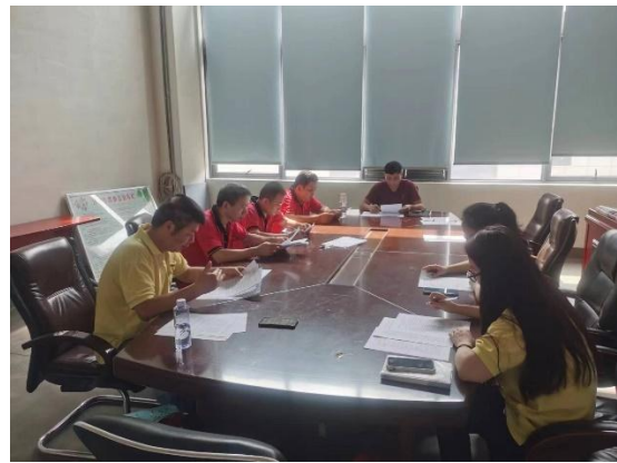
召开应急推演说明会