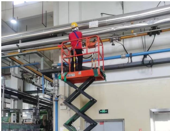
检查天然气泄漏点并处置